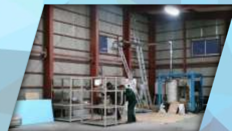
【テクニカルセンター搬入の様子】

待ちに待ったエルコムのテクニカルセンターが3月より正式に稼働します。今後、樹脂ボイラーをはじめ、樹脂ペレット製造機、及び吸引搬送装置などの実機テストをスムーズに行うことができます。多様な樹脂サンプルに応じた燃焼テスト、ペレット成形テスト、搬送テストなどトータル的に行うことができ、さらに加速度を増してエルコムの技術開発を発信してまいります。