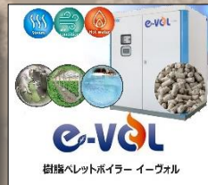
樹脂ペレットボイラー イーヴォル