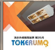
遠赤外線融雪装置 解けルモ