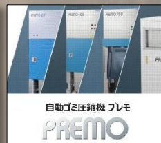
自動ゴミ圧縮機 プレモ