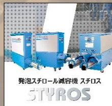
発泡スチロール減容機 スチロス

北のブランドとは札幌市内及び北海道内の企業で独自の技術で開発した製品や技術の販売展開を支援するために様々な専門家構成される「北のブランド選考部会」において審査を行い、認証されます。